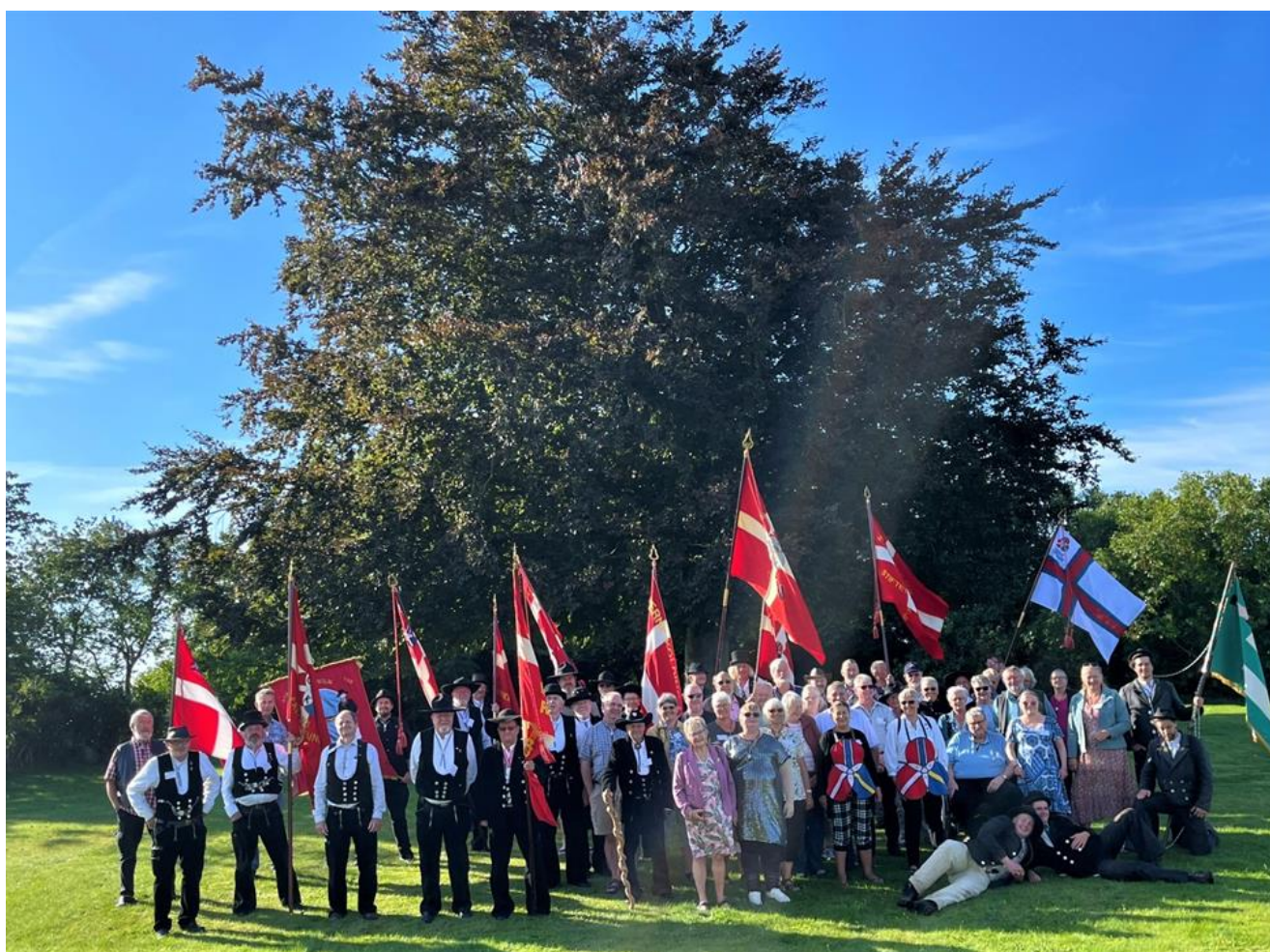
Stævnebillede fra Frederikssund den 3 - 4 - 5. september 2021