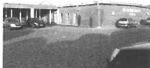
Pinsestævnets Festlokaler „Bannquet Cedervej 17“, Herning