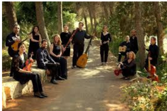
Randers Navernes sangkor