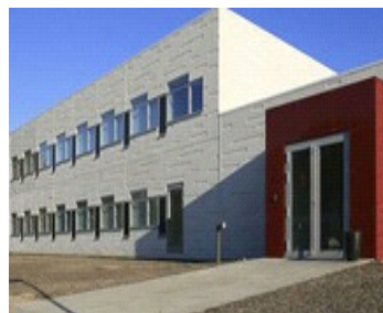
3 F Hadsundvej 184