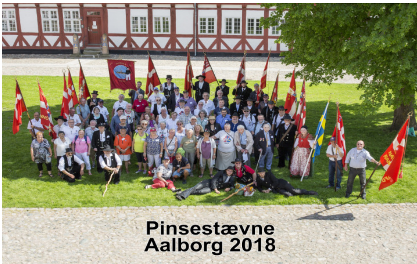
Pinsestævne Aalborg 2018