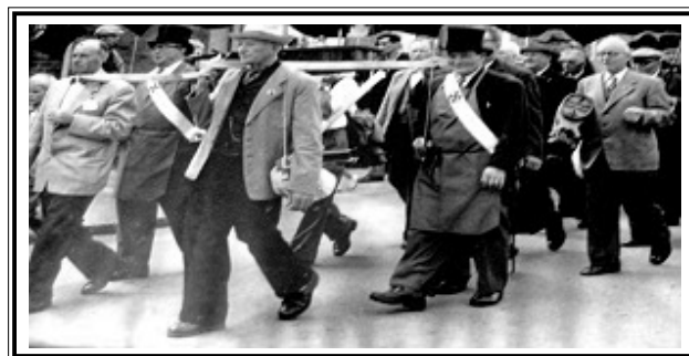
Optog gennem Slagelse 9. august 1958 Slagelse Naverforening flytter fra Jernbanegade 3 til Fruegade 36.

28. september kl. 18:00: Sct. Michaels Nat.