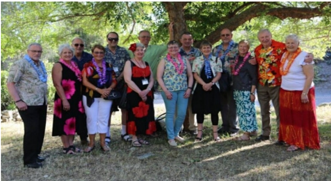
Team Calgary til 85 års jubilæum i Los Angeles.