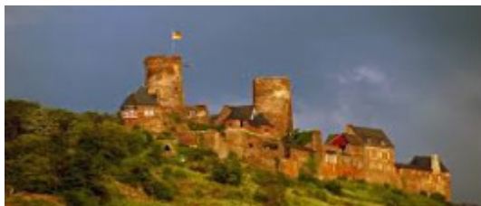
„Burg Thurant“ ved byen Alken.

Lørdag: Efter morgenmaden Bustur til „Burg Thurant“ ved byen Alken hvor vi bliver ført rundt på borgen, bla. også til „forliset“ eller rottehulet (det hul hvor man smed fangerne ned i), skelleterne ligger der stadigvæk, vagttårne. en flot have, kapel, vinkeller, en fantastisk flot udsigt og mere. Efter rundvisningen får vi serveret „Bockwurst med kartoffelsalat“, og drikkevarer skulle der også være nok af. Om eftermiddagen kører vi langsomt tilbage til Mesenich. Festaften.