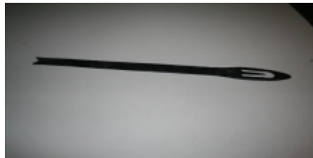
Nål til gennemsticking.

En af forskellene fra egn til egn er fæstningen af taget, og her skelner man mellem ”syede” og ”bundne” tage. I de bundne tage presses materialet fast mod tagets lægter med tækkekæppe, som med et andet materiale bindes fast til tagkonstruktionen med passende mellemrum, i dag anvendes tyk hegns tråd i stedet for tækkekæppe. De ”syede” tage fastholdes tækkematerialet ikke af tækkekæppe, men syes direkte på lægterne i en fortløbende syning. Selve syningen foregår enten med en lang nål der stikkes gennem taget, og så er der en hjælper, der stikker den tilbage til tækkemanden, eller ved hjælp af en krumnål, som tækkemanden selv stikker igennem således at den kommer op til ham igen, det er i dag den mest anvendte metode. Begge metoder er kendt tilbage i middelalderen. Bundne tage blev hovedsagelig brugt på Sjælland og Øerne, på Østfyn og en del af Midtjylland, mens den øvrige del af landet brugte syede tage, men de syede tage har bredt sig mere og mere på bekostning af de bundne.