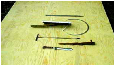
Noget af tækkemandens værktøj.

Tækkematerialet var langhalm eller rør, på hede egne var det ofte lyng, eller lyng og halm, det bedste og længst holdbare var rør.