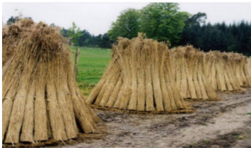
Tagrørene rettes til.

En af forskellene fra egn til egn er fæstningen af taget, og her skelner man mellem ”syede” og ”bundne” tage. I de bundne tage presses materialet fast mod tagets lægter med tækkekæppe, som med et andet materiale bindes fast til tagkonstruktionen med passende mellemrum, i dag anvendes tyk hegns tråd i stedet for tækkekæppe. De ”syede” tage fastholdes tækkematerialet ikke af tækkekæppe, men syes direkte på lægterne i en fortløbende syning. Selve syningen foregår enten med en lang nål der stikkes gennem taget, og så er der en hjælper, der stikker den tilbage til tækkemanden, eller ved hjælp af en krumnål, som tækkemanden selv stikker igennem således at den kommer op til ham igen, det er i dag den mest anvendte metode. Begge metoder er kendt tilbage i middelalderen. Bundne tage blev hovedsagelig brugt på Sjælland og Øerne, på Østfyn og en del af Midtjylland, mens den øvrige del af landet brugte syede tage, men de syede tage har bredt sig mere og mere på bekostning af de bundne.