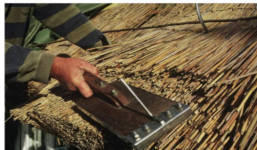
Nyhøstede tagrør til tørring.

Der er flere forskellige udformninger af rygningen, og denne er også egns bestemt. Rygningen udførtes ikke altid af tækkemanden, men ofte af gårdens egne folk, og hertil brugtes ofte halm eller lyng eller tagrygningsdække med rygningstræer. Rygningstræer, også kaldet kragetræer er lavet af flækket egetræ, der i toppen er hæftet sammen med en trænegle, denne er tagets svage led, og blev eftersat når der skulle skiftes halm på rygningen. I nogle jyske hede egne brugte man tidligere lyng, som så blev overdækket med sand eller jord. Ved kysterne anvendte man ofte tang, som blev æltet sammen med ler. Nogle steder nøjes man i dag med løst halm, der så fastholdes med hønsetråd, og derved spare man så kragetræet.