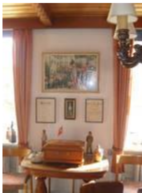
Hulen i Holbæk

Der gøres opmærksom på, at det er direkte afskrift af gl. protokol. Ole Puggaard