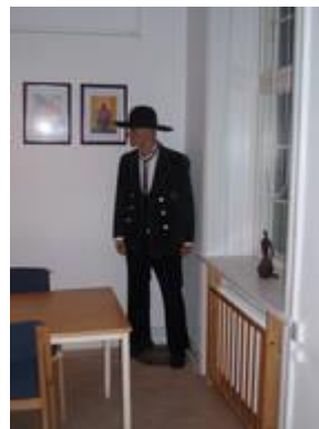
Et medlem i Holbæk?