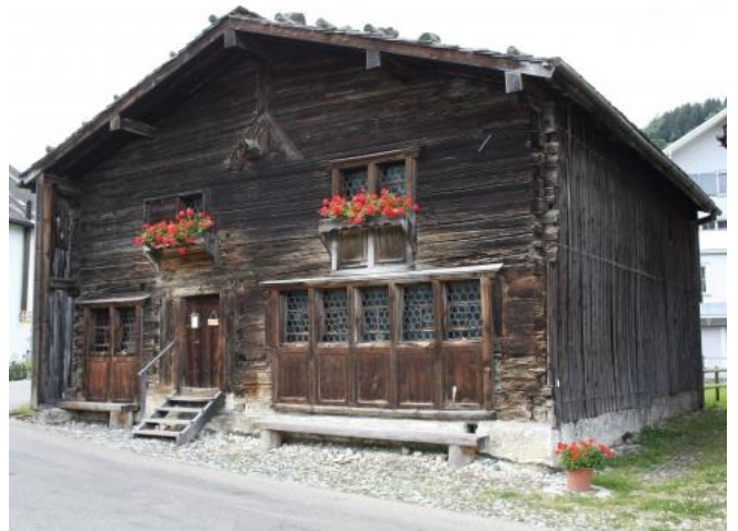
Zwingli museum i Schweiz; se artiklen side 9.

Håndværkernes tur 'på valsen' havde flere formål. Den decentraliserede uddannelse hos håndværks­mesteren var langt fra altid tilstrækkelig. Praksissen med at vandre på de europæiske landeveje skulle sikre, at håndværkssvendene opnåede tilstrækkelige færdigheder og kendskab til forskellige faglige traditioner og metoder. Den skulle socialisere håndværkeren ind i lavenes branchespecifikke skikke og traditioner, som også havde til formål at ekskludere dem, som ikke var medlem af lavene og dermed ikke havde været på valsen. Man havde derfor også særlig påklædning, særlige tiltaleformer mv. Ydermere fungerede vandringerne som en måde, hvorpå arbejdsmarkedet kunne reguleres. De institutionaliserede vandringer betød, at et evt. arbejdskraftoverskud kunne drage hen, hvor der var et arbejdskraftsbehov.