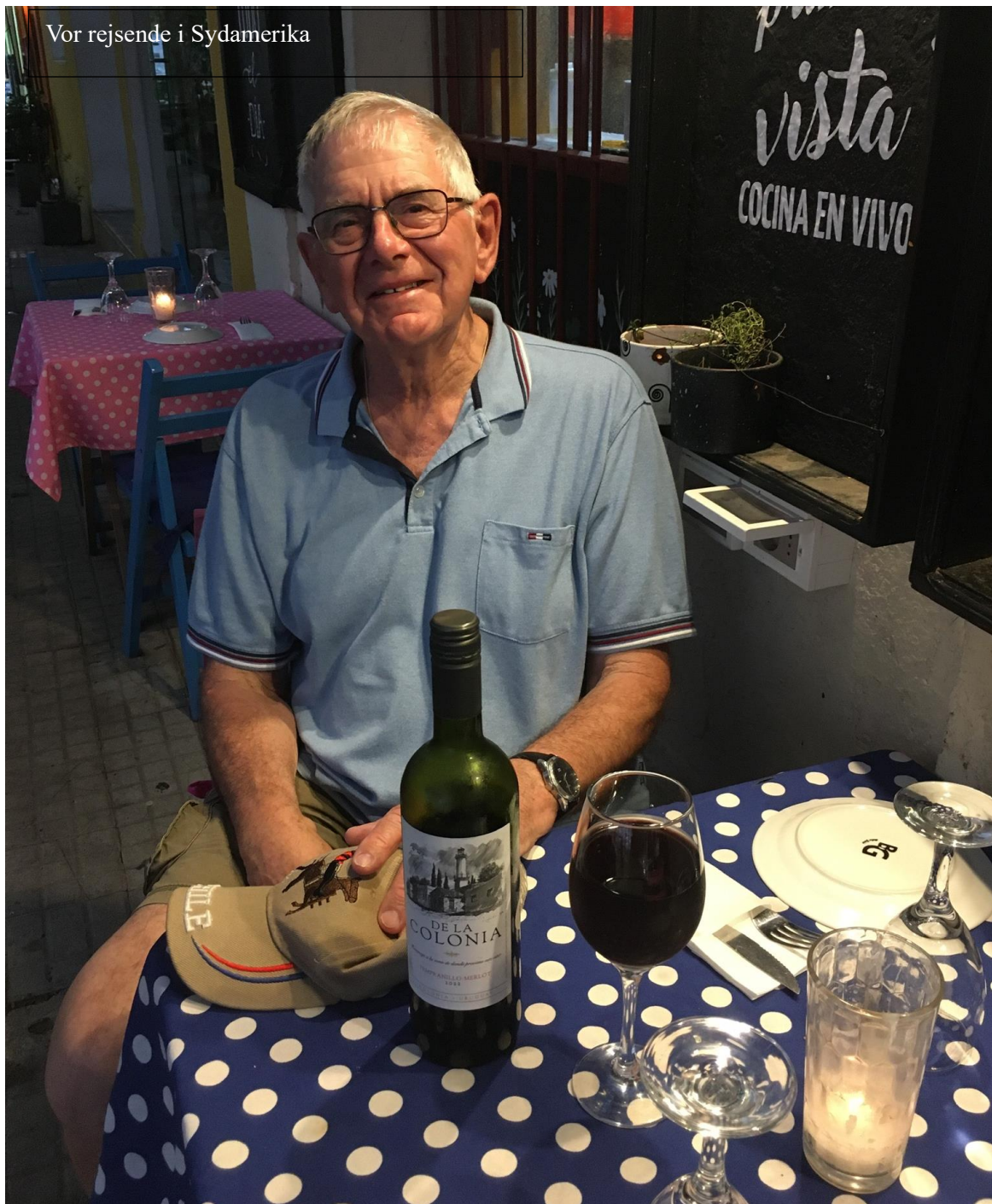
Vor rejsende i Sydamerika