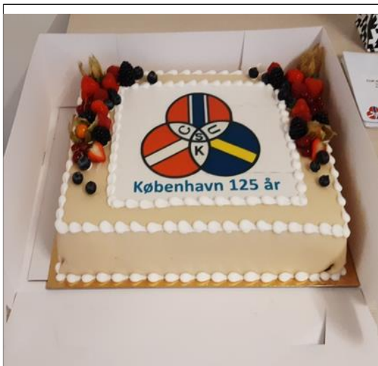
Billeder fra foreningen Københavns 125-års jubilæum den 12. januar 2024. (sikken kage)