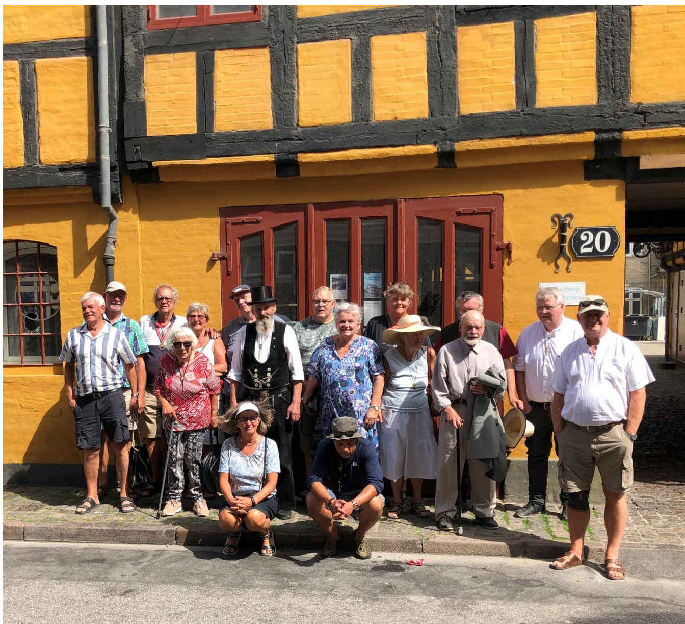
Aalborg er i gang med planlægningen af pinsestævnet i 2025