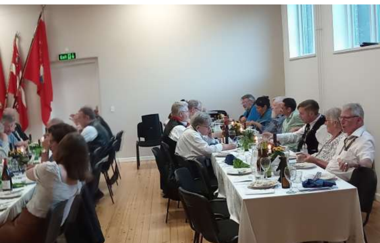
Festaftenen, panorama fra sisik.eu.